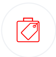
Stock du représentant